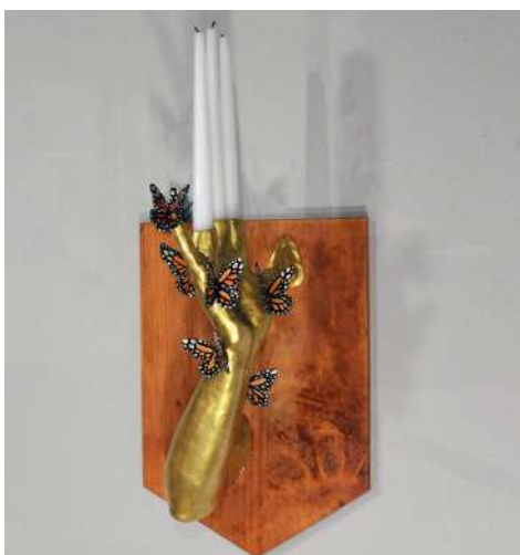
UN ARPENT DE NEZ

À tous les lumineux esprits désirant servir de guides et exaucer des souhaits sans qu'il soit nécessaire pour nous d'y travailler par la pensée, nous déclarons cela: Ici, point de mètre, car c'est l'arpent qui vaut mesure. Certains disent qu'il vaut 180 pieds, d'autres 100 perches ou 30 toises carrées; il faudra sans doute en discuter et pourquoi pas questionner l'idée que l'homme est la mesure de toute chose... à commencer par sa fin.