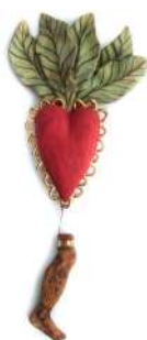
CŒUR ENFEUILLÉ + JAMBE