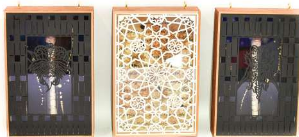
Pièce 1 verso