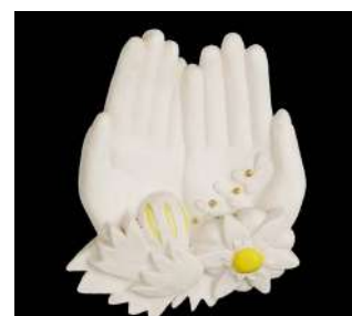
GRAND MODÈLE MAINS