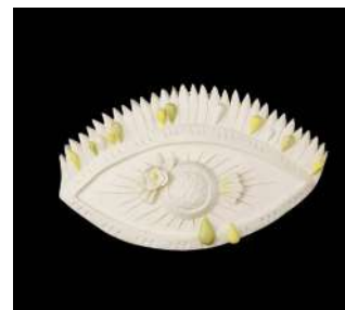
GRAND MODÈLE ŒIL