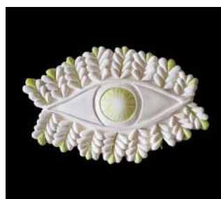
MOYEN MODÈLE ŒIL