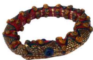
OUROBOROS AU SERPENT DE L'ORIENT

À l'Heurgothique, les animaux fétiches, serpents et lézards, perpétuent cette tradition avec emphase. Les motifs décoratifs en abondance et aux couleurs vives acquièrent ici une aura mystérieuse à la faveur des éclats lumineux de l'or fin.