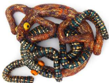
OUROBOROS AUX 2 LÉZARDS