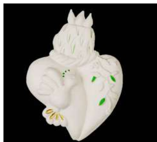
MOYEN MODÈLE CŒUR