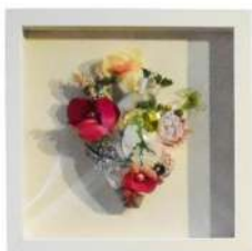
Modèle vitrine carrée pour accrochage mural