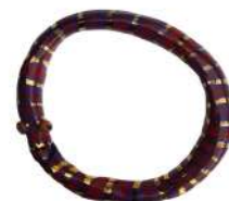
3 PETITS OUROBOROS AU SERPENT