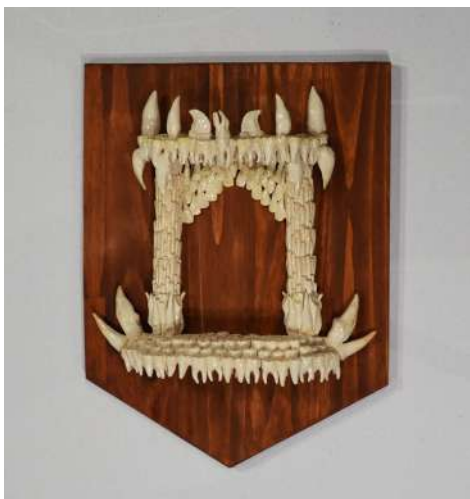
LE PALAIS DE LA GRANDE SOURIS

S'occupant de la récolte des dents définitives, la Grande Souris sillonne terres et mers à la recherche des pièces dentaires les plus extraordinaires. Loin de rémunérer ses innocents donateurs, elle se sert de leurs dents pour composer un Palais bien à son goût. Si la petite histoire de la Grande Souris n'existait pas, il faudrait l'imaginer... Ne serait-ce que pour prendre nos distances avec celle qui nous enseigne que tout - jusqu'à la moindre petite dent de lait - peut se monnayer. Voici déjà la porte de son Palais.