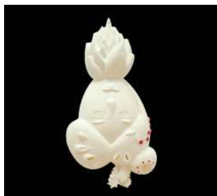
MOYEN MODÈLE TÊTE

Peu à peu, la collection s'agrandit. Je souhaite qu'ils apportent un peu de poésie et révèlent le caractère sacré de notre vie.