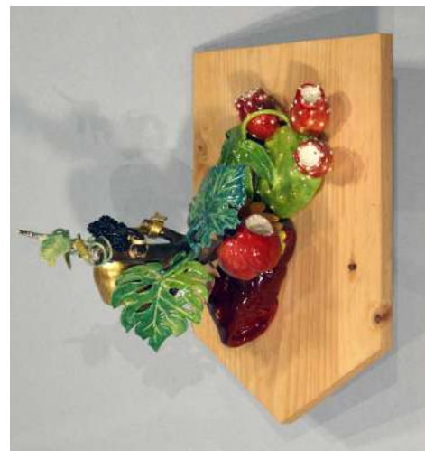
IL ÉTAIT TROIS FOIS...

Il était un foie: celui de Prométhée, dévoré sans fin pour le punir d'avoir partagé le feu des dieux avec les hommes. Il était une foi: celle d'un péché originel, d'un fruit défendu dont la saveur nous aurait offert le savoir, ou celle d'une autre pomme, dorée, cadeau empoisonné et trouble-fête, qui engagera le jugement d'un homme et par la suite, une guerre. Il était trois fois la même histoire où l'on devrait être puni de sa science, de sa conscience ou de ses opinions.