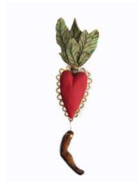
CŒUR ENFEUILLÉ ŒIL + BRAS