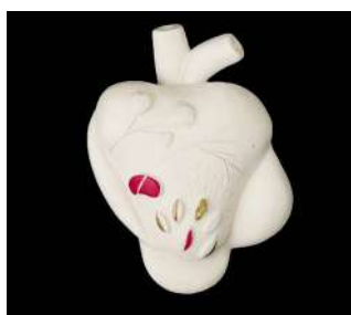
GRAND MODÈLE CŒUR