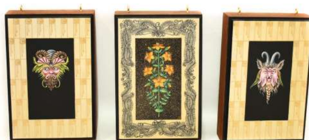
Pièce 1 recto

Ce travail autour des objets magiques s'est finalement transformé en fabrication d'un objet votif personnel où se rejoignent mes propres démons et peurs. Ils sont incarnés par la représentation de deux grotesques et de décors fantasmagoriques. Je laisse, à l'intérieur de la boîte et derrière moi, histoires et angoisses toxiques.