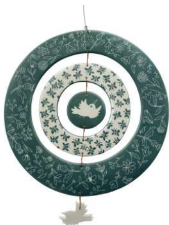
PRIÈRE DE NE PAS DÉRANGER 1

C'est une histoire d'équilibre fragile comme ces pièces en porcelaine suspendues.