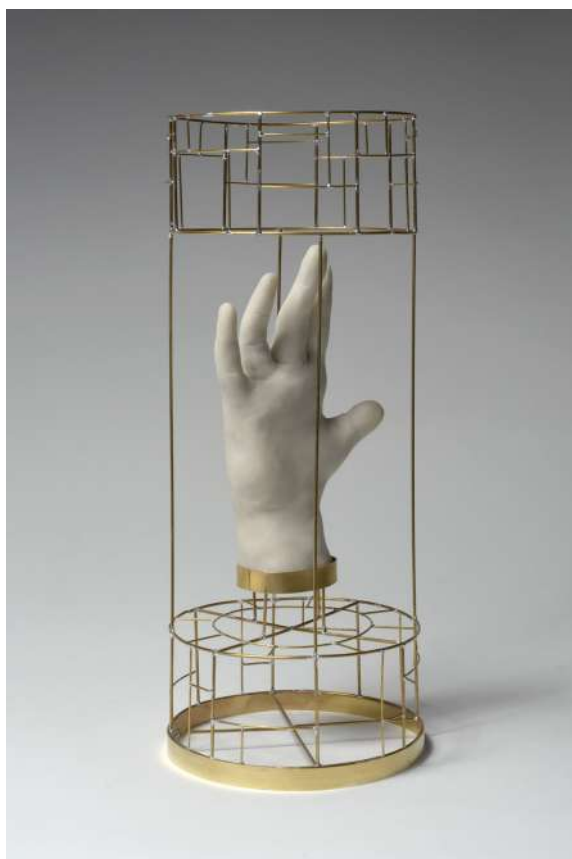
MAINS DANS UNE CAGE