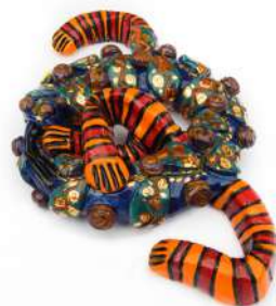
OUROBOROS AU LÉZARD EN PYJAMA