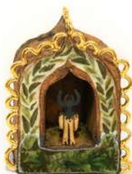
AUTEL VOTIF DENTELLE