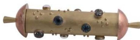
AMULETTE DE PROSPÉRITÉ

Elle est une demande aux forces magiques d'accorder leur protection et d'éloigner le « mauvais œil ». Elle est aussi la représentation du souhait d'accéder à une indépendance matérielle et d'acquérir autonomie et liberté.