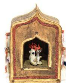
AUTEL VOTIF EX VOTOS