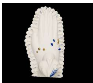
MOYEN MODÈLE MAIN