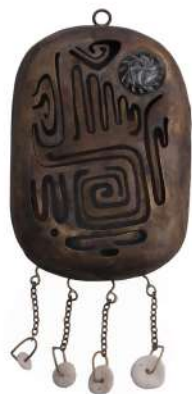
AMULETTE DE CHANCE

Elle représente notre rapport direct à la nature et aux éléments. Elle est une prière adressée à Mère Nature pour le maintien de l'harmonie et de l'équilibre naturel.