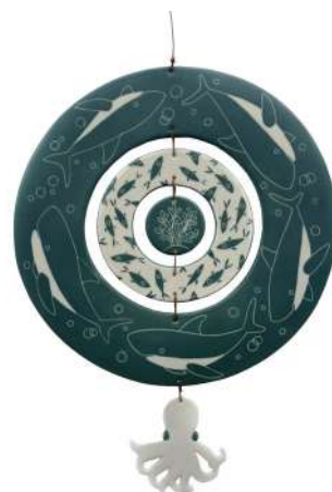
PRIÈRE DE NE PAS DÉRANGER 2

Porcelaine, décor sgraffito (engobe grattée)