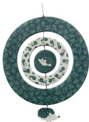
PRIÈRE DE NE PAS DÉRANGER 3

Porcelaine, décor sgraffito (engobe grattée)