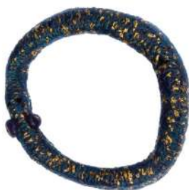
OUROBOROS AU SERPENT BLEU